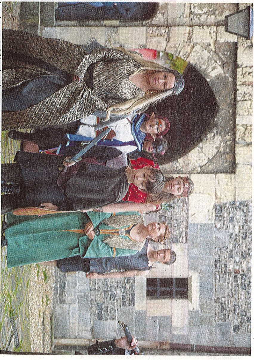
La reine et ses drôles de créatures ont investi le château-musée de Dieppe.