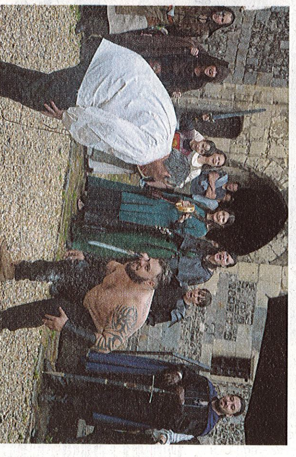
Strongman défié en corps à corps.